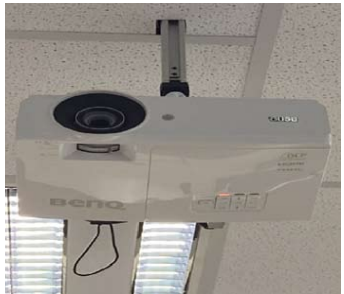
Tageslichtbeamer in allen Klassen mit WLAN-Dongle (Windows/Android/iOS)