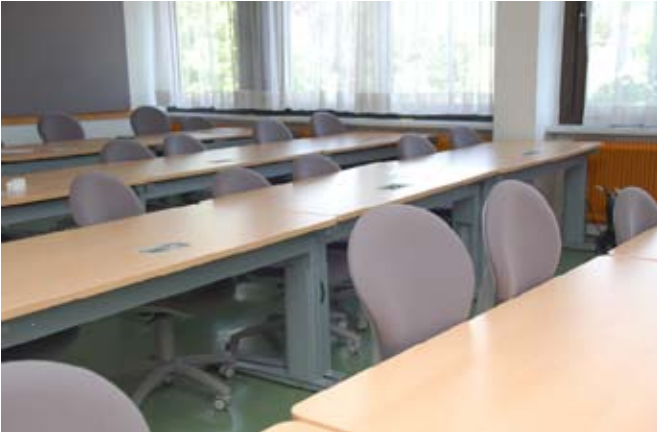
ergonomisch ausgestatteter Klassenraum

Jede Notebook-Klasse bietet eine optimale Ausstattung für den EDV-unterstützten Unterricht. Neu ausgestaltete Klassenräume ausgestattet mit ergonomischen Möbeln, versperbare Notebook-Schränke, Lehrercomputer, Drucker und Projektor müssen auch sorgfältig behandelt werden. Beschädigungen werden den Verursacherklassen in Rechnung gestellt!