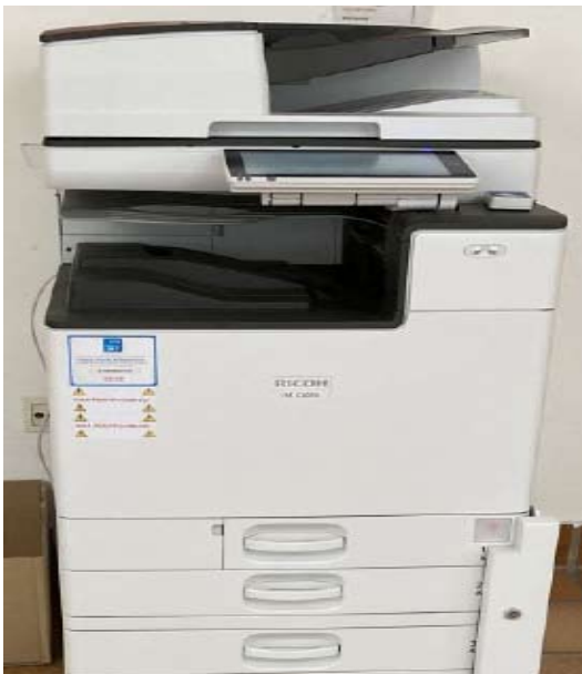
Multifunktionsgerät mit Scan/Copy/Print Funktion am Gang